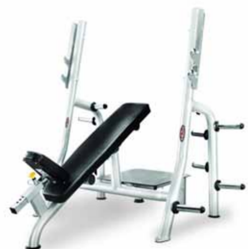
FH-A79 INCLINE PRESS BENCH