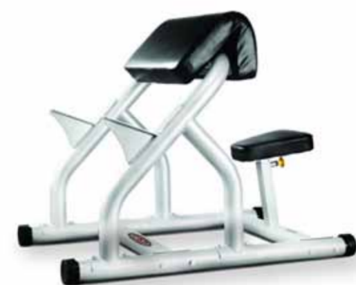
FH-A62 BICEPS ARM CURL RACK