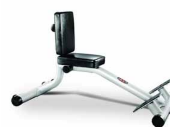
FH-A87 PRESSING CHAIR