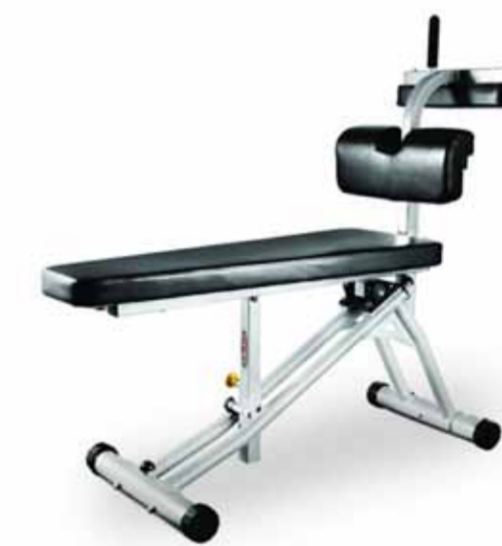
FH-A77 MULTI-FUNCTIONAL BENCH