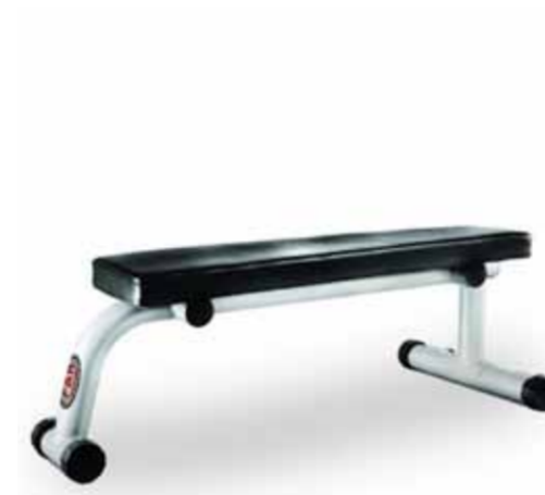
FH-A59 FLAT BENCH