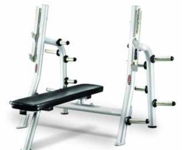
FH-A78 FLAT PRESS BENCH