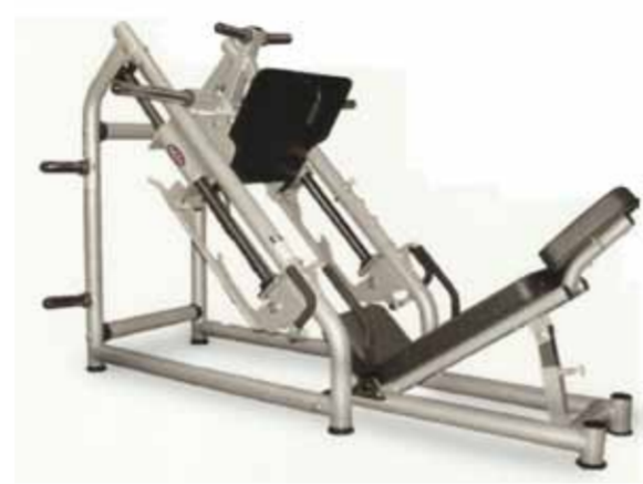
FH-A51 LEG PRESS