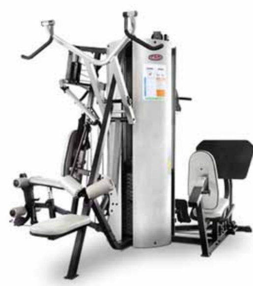
FH-518BK MULTI STATION 5.2