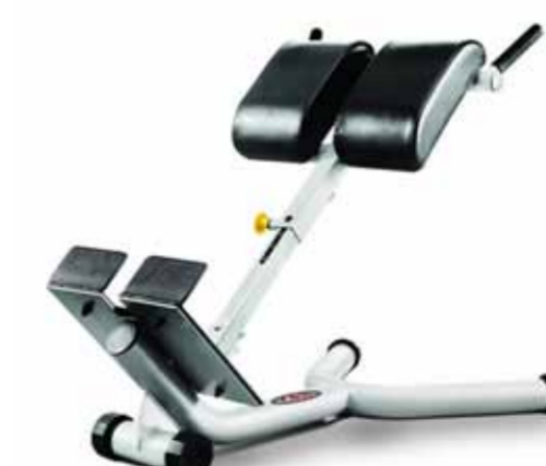
FH-A93 BACK EXTENSION