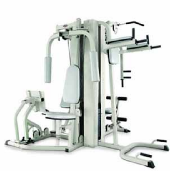
FH-518BI MULTI STATION 5.1