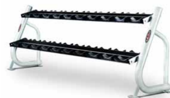
FH-A84 DUMBBELL RACK 3