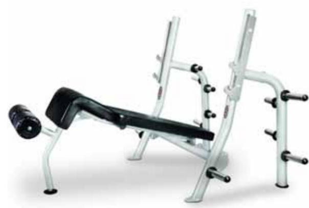
FH-A80 DECLINE PRESS BENCH