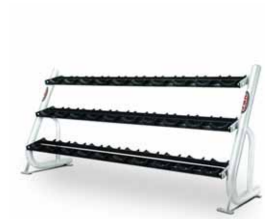
FH-A42 DUMBBELL RACK 1