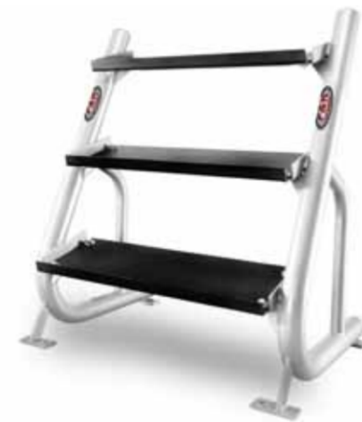
FH-A44 DUMBBELL RACK 2