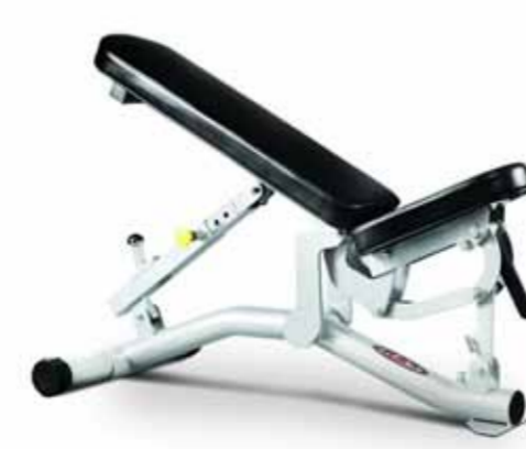
FH-A85 FLAT TO INCLINE BENCH