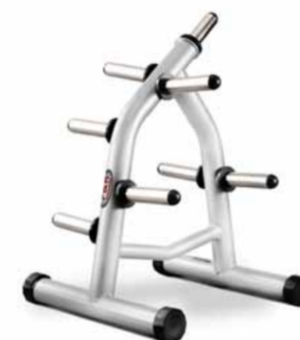
FH-A67 WEIGHT TREE