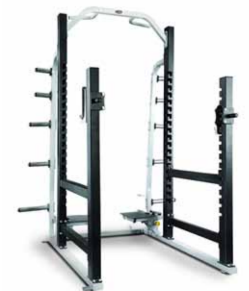
FH-A694 POWER RACK