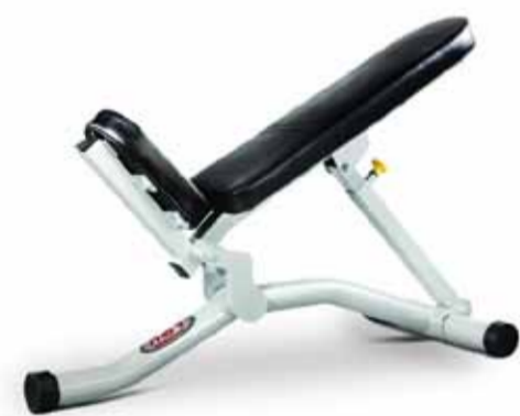
FH-A60 INCLINE BENCH