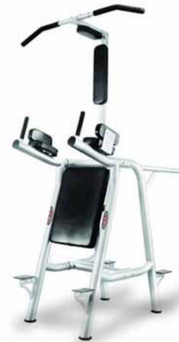
FH-A63C LEG RAISE