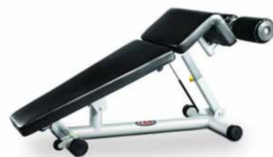
FH-A61 DECLINE SIT UP BENCH