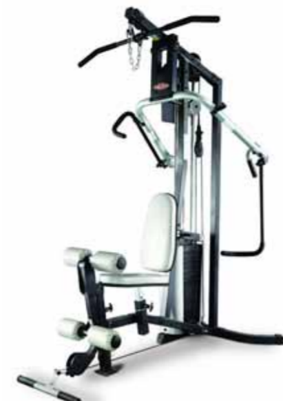
FH-518CI SINGLE STATION 1