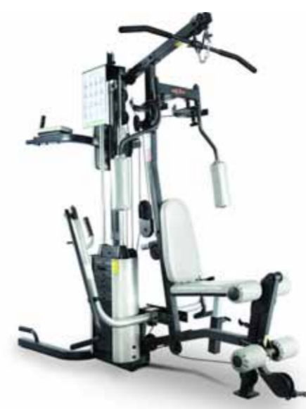
FH-518EC SINGLE STATION 2